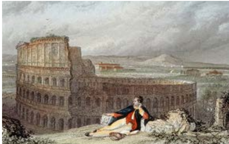
"Lord BYRON contemplant le Colisée de Rome", peint par WILLMORE Bibliothèque des Arts Decoratifs, Paris, France.

Le Grand Tour était un voyage entrepris par les jeunes hommes, principalement, de bonnes familles à partir de la fin du 17e siècle.