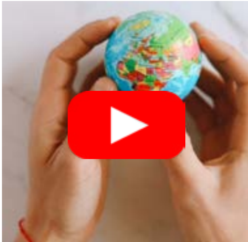
Les séjours éducatifs, une ouverture sur le monde