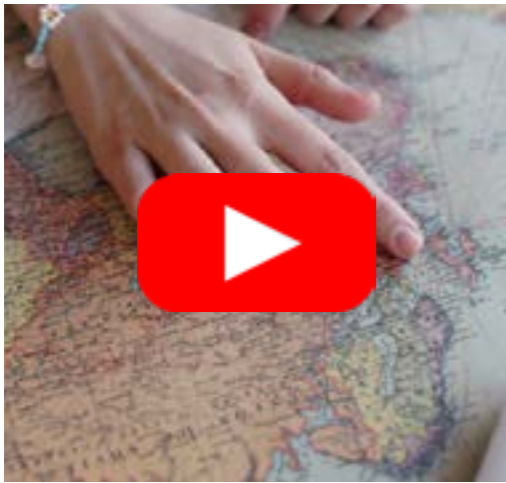
Le séjour éducatif, ce n'est pas que pour les enfants !