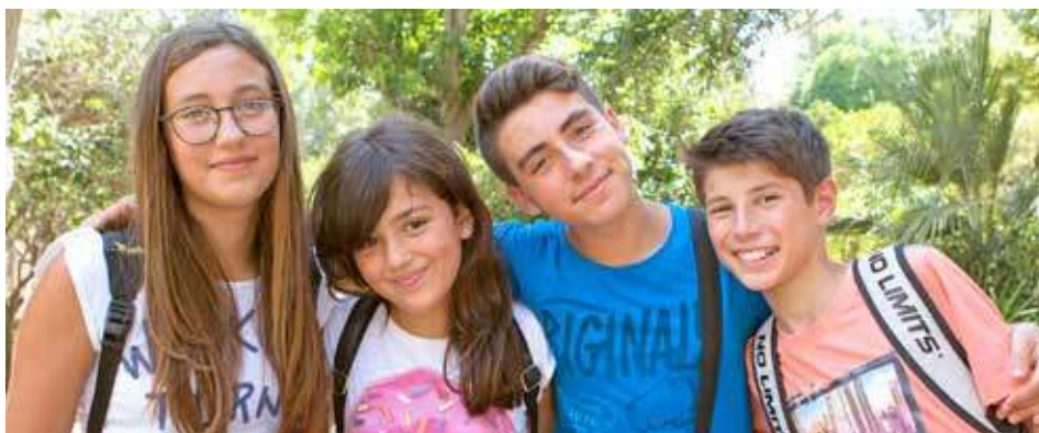
Adolescents partis à Malte. (EC)

S.B. : D'abord, les audits car ils permettent de mesurer le sérieux de l'organisme qui souhaite être accepté au sein de l'UNOSEL. Nous mettons l'accent sur l'éthique des adhérents qui se regroupent pour un partage d'expérience. Un autre point fort également est que l'UNOSEL est signataire de la Charte de la Médiation du Tourisme et du Voyage, ce qui garantit à tous les participants l'indépendance et l'impartialité dans le traitement des dossiers de médiation. Nous respectons les normes européennes et j'insiste sur le fait que nous menons une réflexion continue sur l'évolution de nos métiers : les attentes des apprenants évoluent avec les nouvelles technologies et l'introduction plus précoce de l'apprentissage des langues.